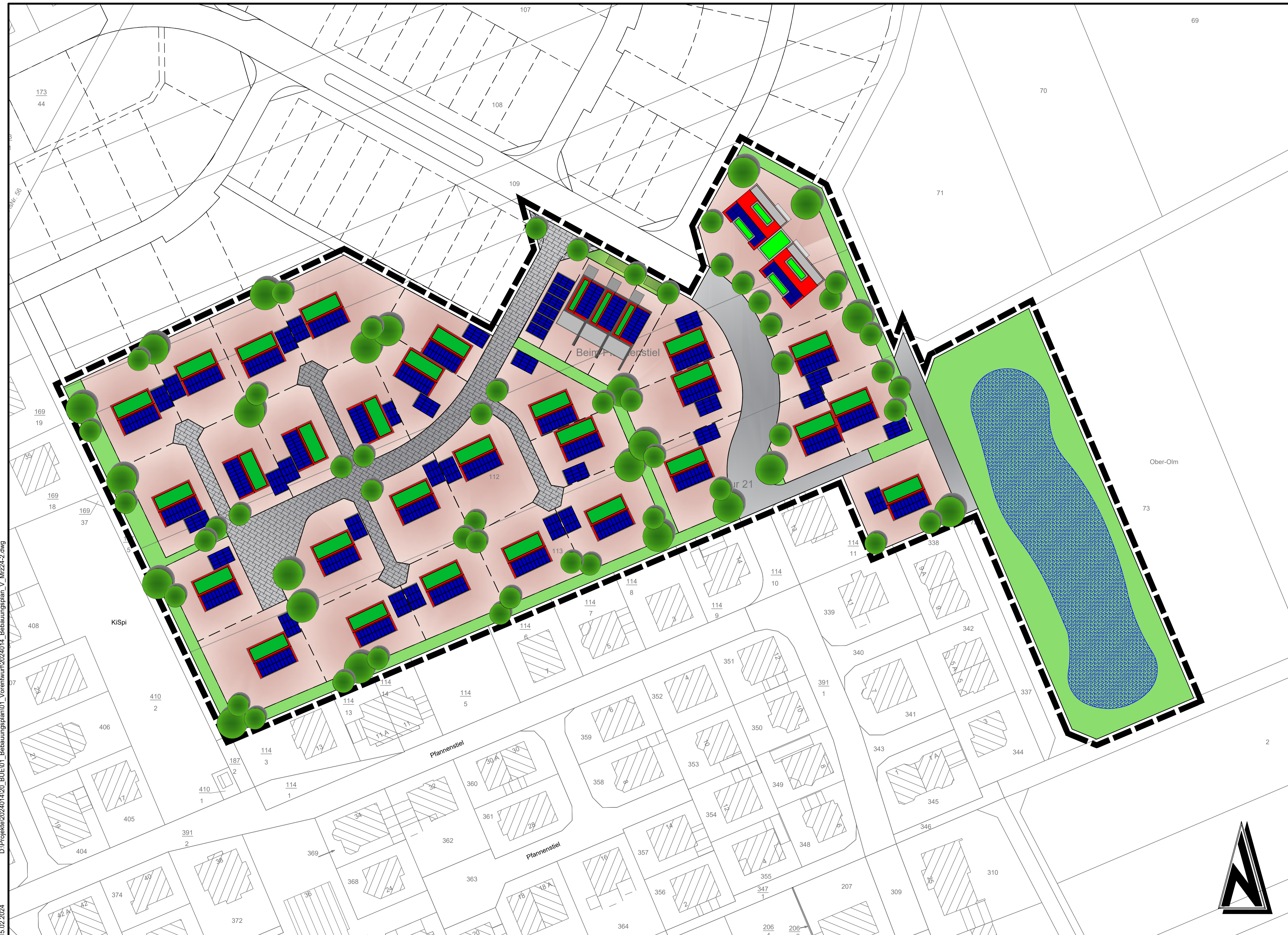
Übersichtsplan ohne Maßstab